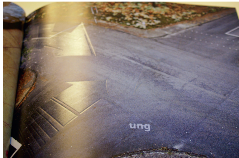
Kaltfolie und Bilderdruck, WhiteInk, 4C, Textured Effect und partiell transparente Farbe auf der Prägung.

Natürlich wurde im Rebus-Buch nicht nur mit Worten, sondern in erster Linie mit Materialien und Effekten gespielt. Neben klassischen Bilder-